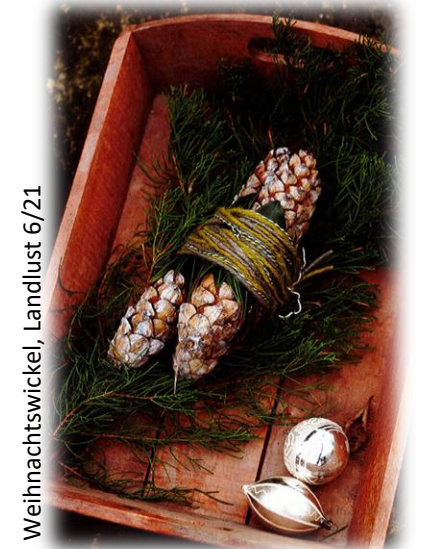
Weihnachtswickel, Landlust 6/21

Anmeldung mit Angabe zu Gruppe (A oder B). Vorrang haben Anmeldungen mit jungen Menschen. Bitte an yw@gartissimo.de (Bitte Bestätigung abwarten, da die Zahl der Plätze begrenzt ist.)